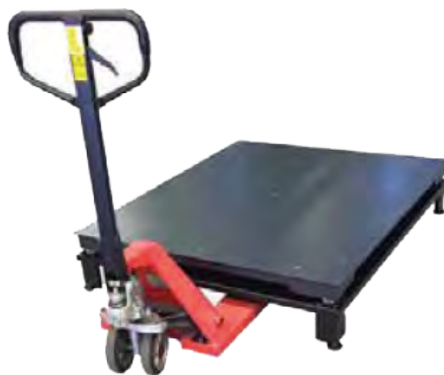
Cavalletto porta piattaforme h 200 mm